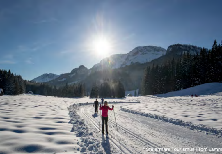
Steiermark Tourismus | Tom Lamm