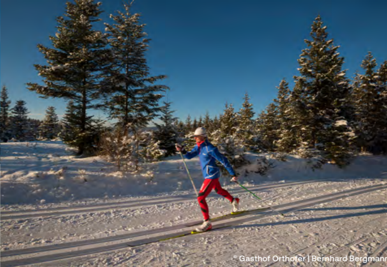
Gasthof Orthofel | Reinhard Bergmann