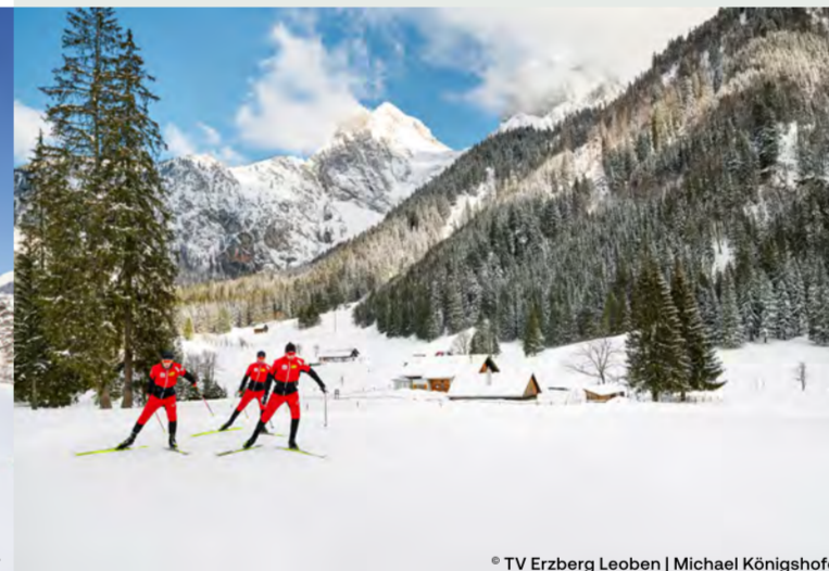
TV Erzberg Leoben