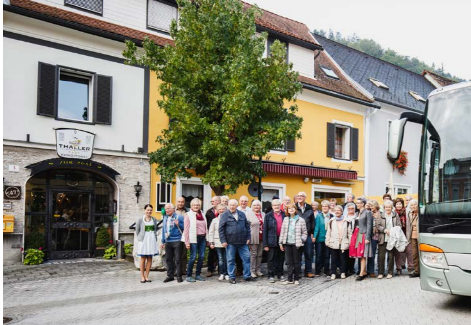
© Busreisen Steiermark / Alexander Rauch (3)