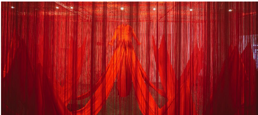
© Bildrecht GmbH, Wien, 2024 and the artist, photo Ding Musa